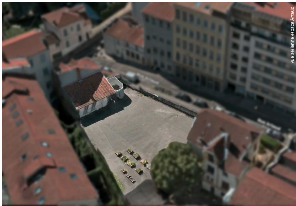
vue aérienne espace Artaud

L'Espace Artaud est une salle de plain-pied d'une superficie de 71 m 2 implantée sur un terrain d'environ 600 m 2 . Le ou la résident-e n'est pas logé-e sur place, mais bénéficie de toutes les commodités utiles à un séjour diurne.