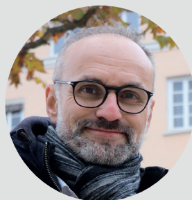
Rémi ZINCK Maire du 4 ème arrondissement de Lyon