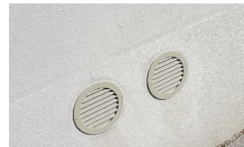
↑ Exemple de bouches d'aération d'un climatiseur intérieur