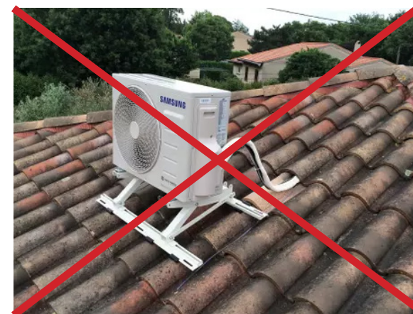
↑ L'installation d'un bloc de climatisation en toiture d'un immeuble doit être intégrée qualitativement