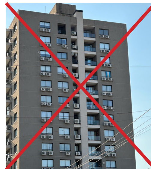
↑ L'installation d'un bloc de climatisation en façade d'un immeuble doit être intégrée à la construction sans émergence en façade.

→ Sous réserve du respect du décret n°2010-349 du 31 mars 2010 et de l'arrêté du 16 avril 2010 relatifs à l'inspection des systèmes de climatisation et des pompes à chaleur réversibles dont la puissance frigorifique est supérieure à 12 kW et de l'Arrêté du 24 juillet 2020 relatif à l'inspection périodique des systèmes thermodynamiques et des systèmes de ventilation combiné à un chauffage dont la puissance nominale utile est supérieure à 70 kilowatts