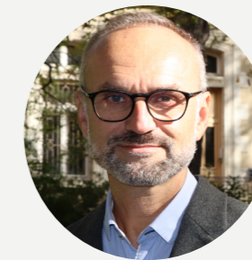
Rémi ZINCK Maire du 4 ème arrondissement de Lyon