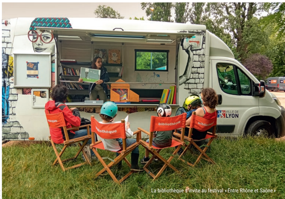
La bibliothèque s'invite au festival « Entre Rhône et Saône »