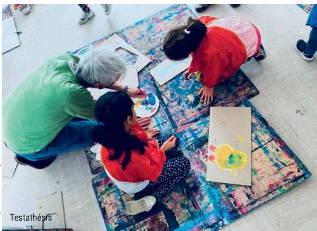
© Antiquarks - Coin Com productions