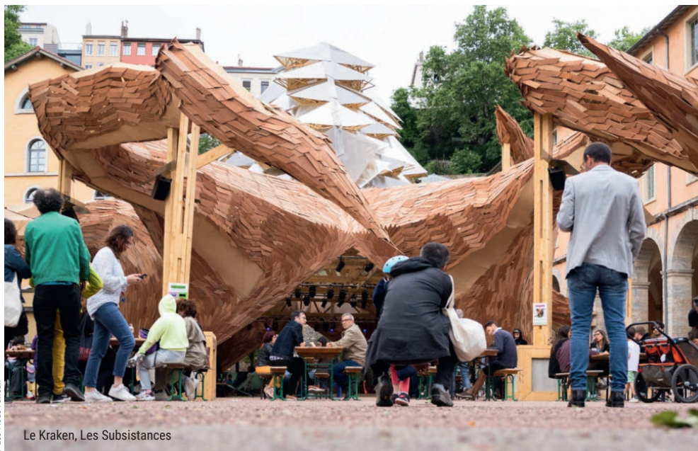
Le Kraken, Les Subsistances

— La fête de quartier Perrache-Confluence Hippo'Camp, est de retour cet été ! La bibliothèque du 2 e et le bibliobus y proposeront des espaces de lecture autonome et de détente autour du bibliobus pour grands et petits. Des lectures animées et Kamishibais, des coloriages en réalité augmentée ou en encore un atelier badges. Hippo'Camp sera aussi une fête avec des jeux pour tous les âges, des ateliers, des concerts, une exposition, des visites du quartier, des pôles de restauration et des rencontres.