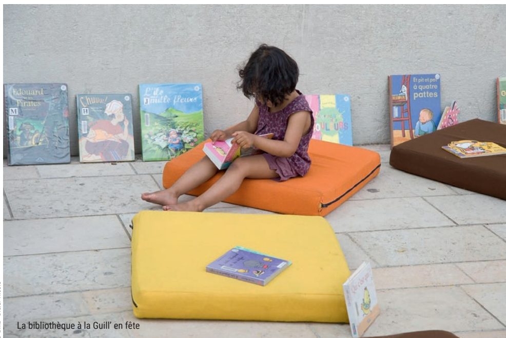
La bibliothèque à la Guill' en fête